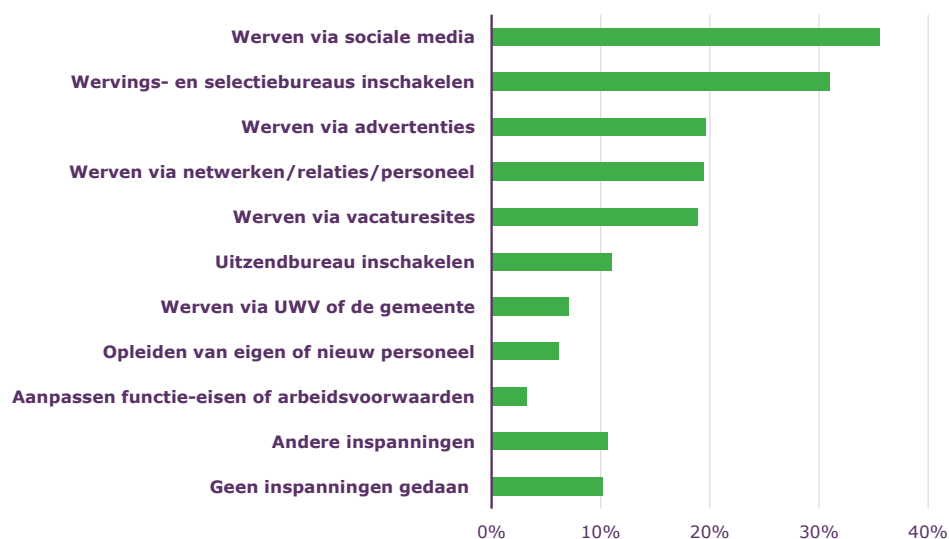
Figuur 1 Inspanningen om moeilijk vervulbare vacatures toch te vervullen

Naar sector bekeken worden social media relatief vaak ingezet in de sectoren 'Bouw' en 'Horeca' (niet in tabel). Het inschakelen van een wervings- en selectiebureau of headhunter gebeurt relatief vaak in de sectoren 'Industrie', 'Groothandel' en 'Communicatie en informatie'. In de sector 'Landbouw' kiezen bedrijven er naar verhouding vaak voor om een uitzendbureau in te schakelen.