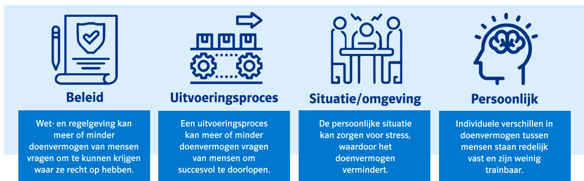
Figuur 2 Vier niveaus van belang voor doenvermogen in UWV-context

Op basis van die literatuurstudie concluderen we dat het persoonlijke en situationele niveau van doenvermogen beperkt te beïnvloeden zijn door UWV, maar wel belangrijk zijn om rekening mee te houden. Zo laat wetenschappelijk onderzoek zien dat er grote verschillen bestaan in de mate waarin mensen beschikken over doenvermogen en dat het individuele doenvermogen moeilijk te beïnvloeden is door middel van training. 7 Bovendien kan de situatie het doenvermogen tijdelijk verminderen. Bepaalde gebeurtenissen in het leven, veranderingen in de situatie of de omgeving van een persoon kunnen stress veroorzaken waardoor diens doenvermogen tijdelijk onder druk komt te staan. Een bepaalde mate van stress zal bij UWV-cliënten, die te maken hebben met levensgebeurtenissen zoals werkloosheid, ziekte of de geboorte van een kind, zeker een rol spelen. Alhoewel UWV weinig invloed heeft op het persoonlijke en situationele niveau kan het bij de individuele dienstverlening aan cliënten wel rekening houden met individuele verschillen in doenvermogen en de effecten van stress.