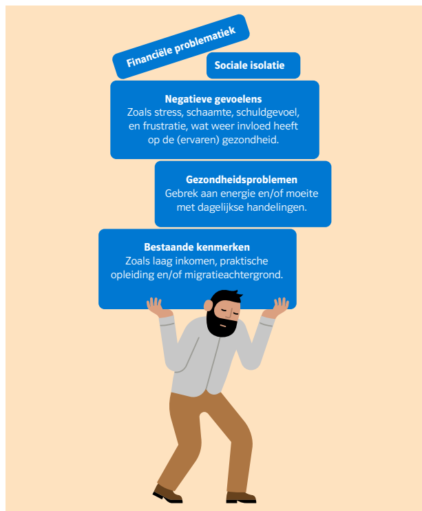
Figuur 4: Stapeling van problemen bij 35-minners

dat hun sociale netwerk kleiner is geworden als gevolg van de ziekte, wat hun negatieve gevoelens vergroot. De mensen die zich eigenlijk te ziek voelen om te kunnen werken, maar wel werken omdat ze anders in de financiële problemen (kunnen) komen, ervaren het moeten werken als negatief, omdat dit veel energie kost en de gezondheidsproblemen kan verslechteren. Als mensen moeite hebben om financieel de eindjes aan elkaar te knopen, of zelfs in de schulden terechtkomen, dan heeft dat ook weer effect op hun sociaal-emotioneel welbevinden. Een goede inkomenspositie is weliswaar geen bescherming tegen sociaal-emotionele problemen, maar andersom geldt wel dat financiële problemen vrijwel altijd sociaal-emotionele problemen met zich meebrengen. De geïnterviewden met schulden hadden zonder uitzondering ook problemen op sociaal-emotioneel vlak. De financiële problemen leidden tot schuldgevoel ('Moet ik mijn kinderen onder deze omstandigheden laten opgroeien?') en stress ('Ik moet werken om financieel rond te kunnen komen, maar dat lukt me niet'). Deze stress kan vervolgens weer de (ervaren) gezondheid negatief beïnvloeden. [1]