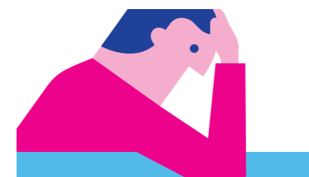
NOG STEEDS ZIEK