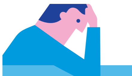
ZIEK UIT DIENST